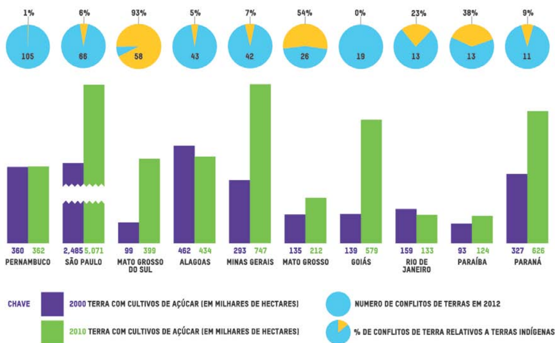
Figura 2: Cultivo de cana-de-açúcar no Brasil entre 2000 - 2010, mostrando conflitos de terras em 2012

FONTE: UNICA Data http://www.unicadata.com.br/historico-de-area-ibge.php?idMn=33&tipoHistorico=5 ; CIMI (2012) 'Violência contra os povos indígenas no Brasil 201', http://www.cimi.org.br/pub/viol/viol2012.pdf ; FUNAI, Instituto Socioambiental (ISA), E Comissão Pastoral da Terra (CPT).