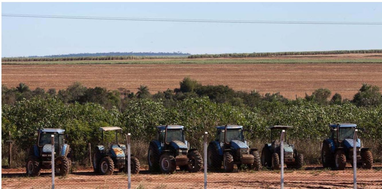
Tratores em uma plantação de cana de açúcar ocupam terras indígenas dos Guarani-Kaiowá, em Mato Grosso do Sul. A comunidade, agora sem terra, vive em acampamento temporário ao longo da BR-163.